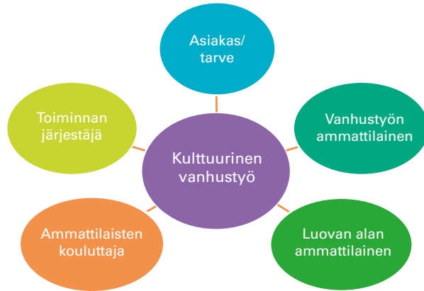
Kuvio 1 Näkökulmia kulttuuriseen vanhustyöhön

Tätä kehittämistyötä tehdään kaikkien näiden näkökulmien yhteistyönä ja tässä yhteistyössä (kuvio 1) tarvitaan eri ammattiryhmiä ja organisaatioita.